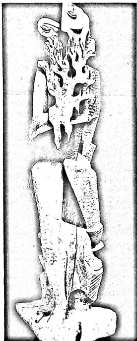
(«Prometeo», de Zadquine)

Además, la aparición pública de la Junta Democrática de España en el momento justo en que se desencadenó la sordida disputa por la Sucesión entre las distintas camarillas que controlan el Estado, desveló a tiempo la conciencia histórica de la necesidad de una acción cívica, común a todas las clases sociales y